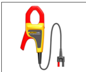
电流钳 I400E: 配合全新福禄克掌上系列万用表, 包括 Fluke101, Fluke106, Fluke107 使用, 能够扩展这些万 用表的电流测试能力, 同时, 该电 流钳, 也适用于所有具有毫伏交流 测试功能的测量仪器。