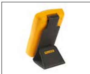
智能磁性挂件 Smart Strap: 适用于 101/106/107;